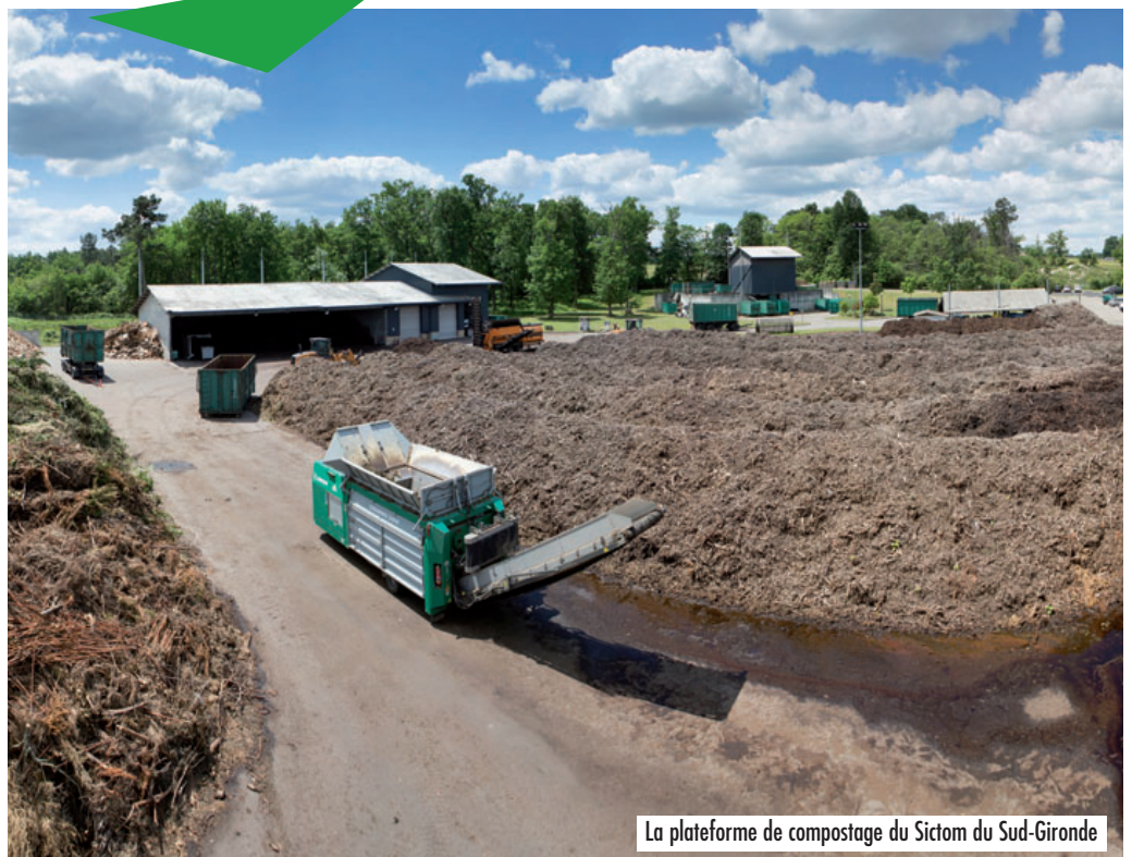
La plateforme de compostage du Sictom du Sud-Gironde

Le syndicat propose aux usagers du territoire des composteurs ou des lombricomposteurs au tarif de 10 euros. Le composteur est gratuit dès lors que vous avez suivi une sensibilisation d'environ une heure.